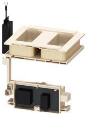
bobina magnética para contator 3TF6944-.C., CA 110...132V 50/60Hz