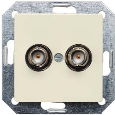
DELTA i-system branco elétrico bucha de contato BNC 2x 75 Ohm 55x55mm