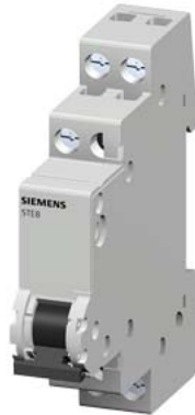
interruptor de controle 20A 1NA 1 lâmpada 48V