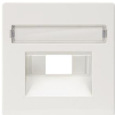
DELTA i-system branco titânio cobertura cat. UAE 3, simples e 2x, rótulo