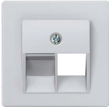
DELTA i-system metálico alumínio cobertura cat. UAE 3, simples 55x55mm