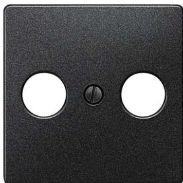
DELTA i-system carbono metálico placa de cobertura TV/RF/SAT, 2 furos 55x55mm