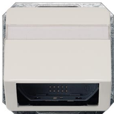
DELTA perfil branco titânio saída oblíqua para cabo de fibra óptica