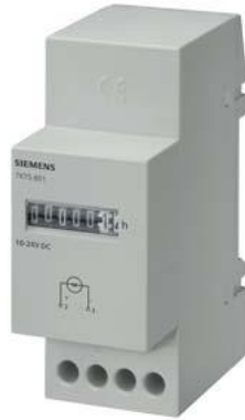
cronômetro, mecânico, 115V, 50Hz