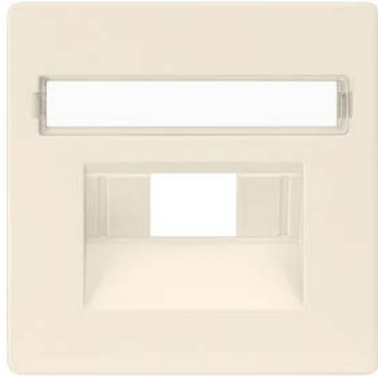
DELTA i-system branco elétrico cobertura cat. UAE 3, simples e 2x, rótulo