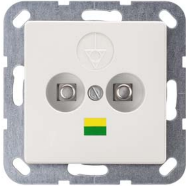
DELTA i-system branco titânio tomada equipotencial dupla 55x55mm