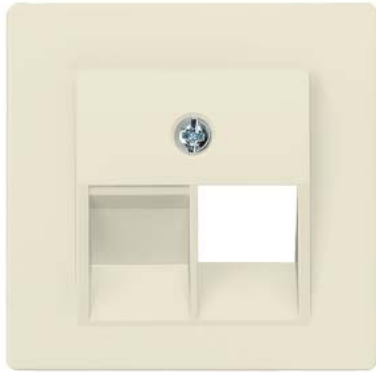
DELTA i-system branco elétrico cobertura cat. UAE 3, simples 55x55mm