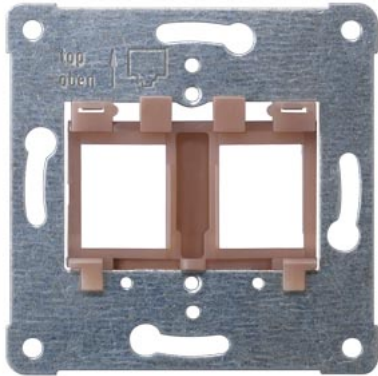
DELTA placa de suporte jack modular inserto marrom