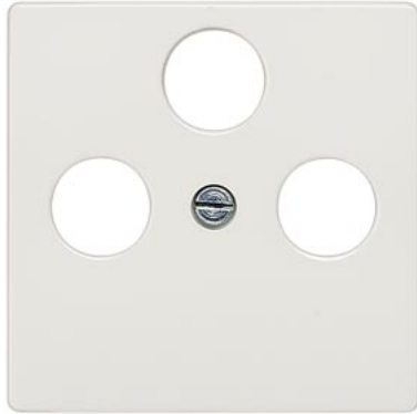
DELTA i-system branco titânio placa de cobertura TV/RF/SAT, 3 furos 55x55mm