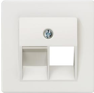
DELTA i-system branco titânio cobertura cat. UAE 3, simples 55x55mm