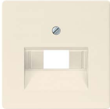
DELTA i-system branco elétrico cobertura cat. UAE 3, simples e 2x 55x55mm