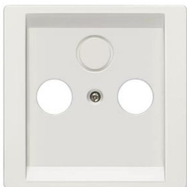
DELTA style branco titânio placa de cobertura TV/RF/SAT, 3 furos 68x68mm