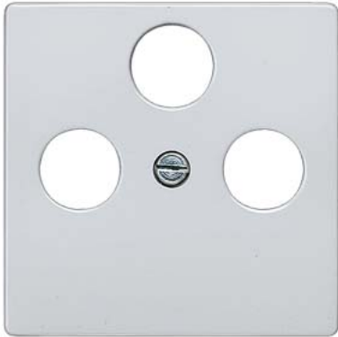
DELTA i-system metálico alumínio placa de cobertura TV/RF/SAT, 3 furos 55x55mm