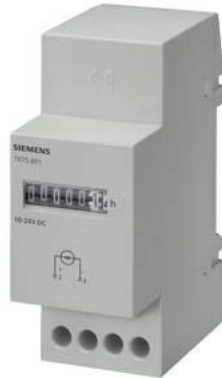
cronômetro, mecânico, 24V, 50Hz