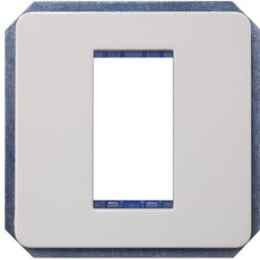
DELTA perfil suporte de módulo, simples branco titânio fixação roscada