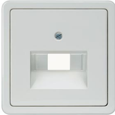
DELTA perfil cobertura prata cat. UAE 3, simples e 2x 65x 65mm