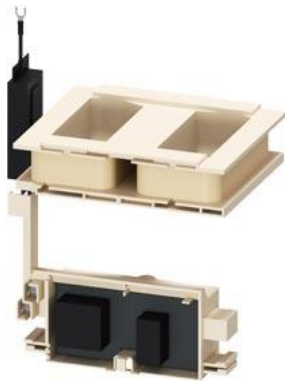
bobina magnética para contator 3TF6944-.C., CA 380...460V 50/60Hz