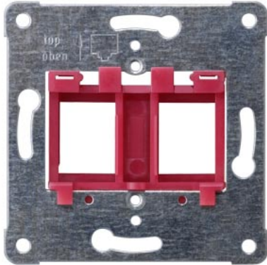
DELTA placa de suporte jack modular inserto vermelho