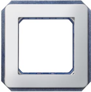
DELTA i-system metálico alumínio suporte de módulo, 2x 55x55mm fixação rosca