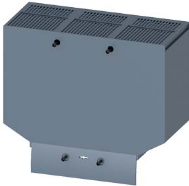
tampa de terminal alargada de 3 polos 1 peça acessórios para: 3VA13/14 3VA23/24