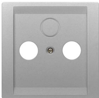
DELTA style metálico platina placa de cobertura TV/RF/SAT, 3 furos 68x68mm