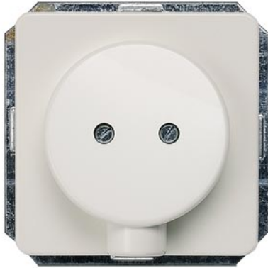
DELTA perfil branco titânio placa de saída