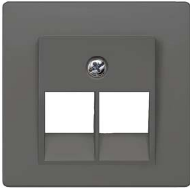
DELTA i-system carbono metálico cobertura cat. UAE 3, 2x 55x55mm