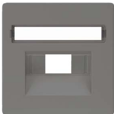
DELTA i-system carbono metálico cobertura cat. UAE 3, simples e 2x, rótulo