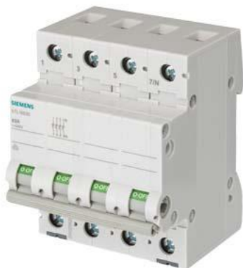
chave seccionadora, chave liga/desliga 125 A de 3 polos+N