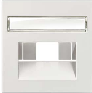
DELTA perfil prata cobertura cat. UAE 3, simples e 2x com rótulo 65x 65mm