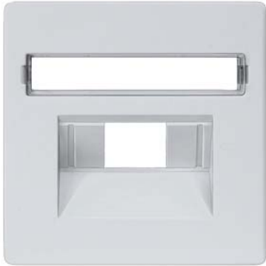
DELTA i-system metálico alumínio cobertura cat. UAE 3, simples e 2x, rótulo