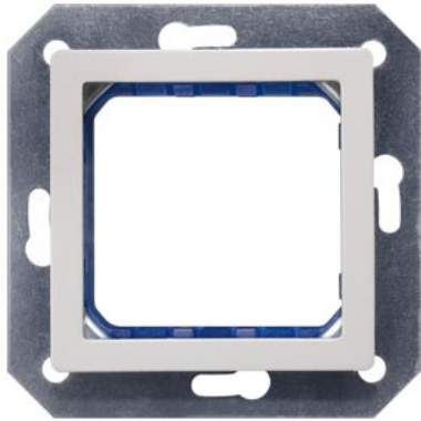
DELTA i-system branco titânio suporte de módulo, 2x 55x55mm fixação roscada