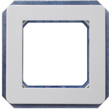
DELTA perfil suporte de módulo, 2x prateado fixação roscada